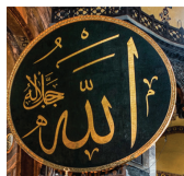
「アッラー」 アラビア語で

モスク（マスジド） ：イスラム教徒が主に祈りと礼拝のために使用する穢れのない清らかな所のこと。