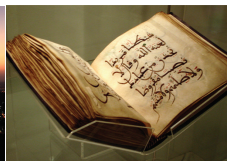
偉大なるコーラン