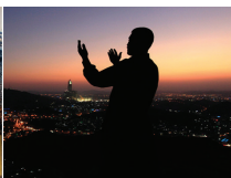
アッラーに祈りを 捧げるイスラム 教徒